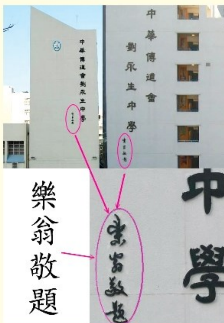
▲「樂翁敬題」。校名題字人是王齊樂先生。由於他字明夫，號樂翁，所以他以「樂翁」署名。

王齊樂先生曾獲多項殊榮，包括在1992年獲選為「香港優秀教育工作者」、1994年獲港督頒授「社區服務獎狀」、1995年獲英女皇頒授「榮譽勳章」、2000年獲香港教師會頒授「金鐸獎」、2001年獲香港大學專業進修學院頒授「傑出導師獎」等。