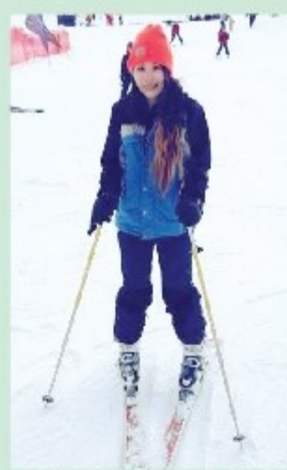
▲紐西蘭南島皇后鎮(Queenstown)雪山

入讀社工系後，我才發覺其實這條路是神為我安排的，是一個神蹟。社工系有很多自我反思的機會，甚至有一科是要我們學習認識自己，因為助人前要先助己。神給我機會重新了解自己的生命，解開一些心結，得到從神而來的信心。神讓我緊記一句金句——「行公義，好憐憫，存謙卑的心，與你的神同行。」(彌迦書6：8)