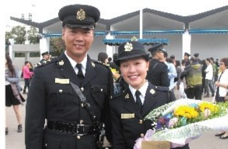
▲海關學堂畢業時與長官合照 (2014年)