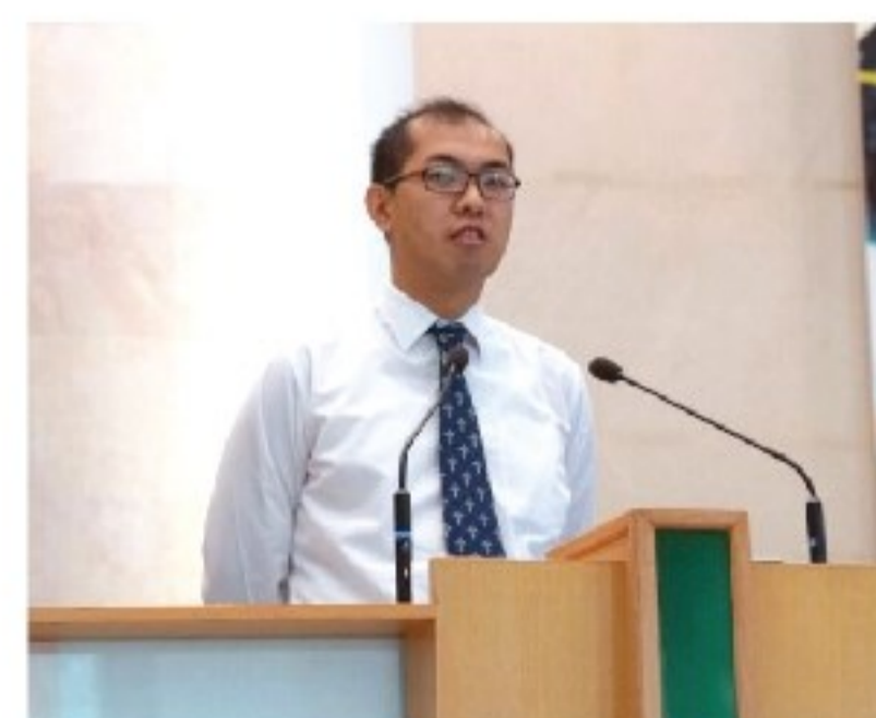
▲在教會講壇分享時的照片

(後記感言：我在劉永生中學雖然只讀了短短一年，但為甚麼會這麼愛這所學校，自己也不清楚，可能是師長們的愛。我至今仍然記得你們如何關心每一位同學，那種埋身的關顧及愛正正是我需要學習的。願劉永生中學繼續祝福更多的年輕人，引領人來到上帝面前；願主耶穌加力給每個老師，以祂的愛去繼續愛每一個學生！)