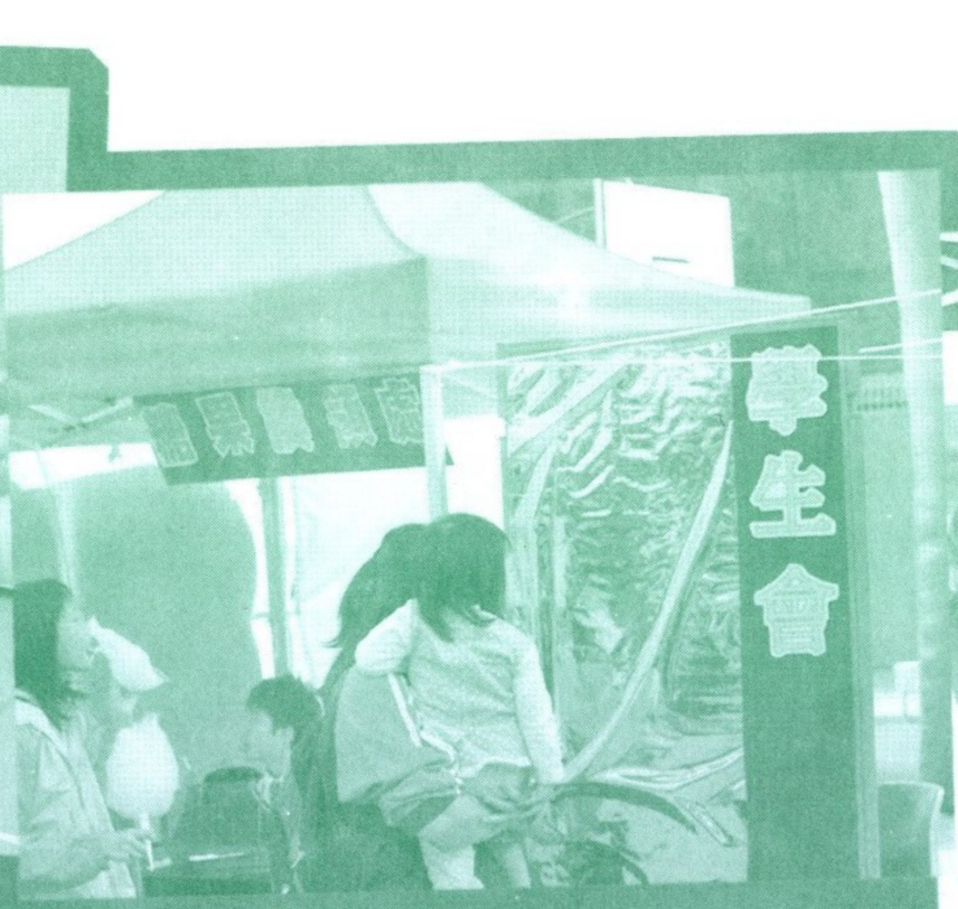
學生會幹事於開放日工作情況