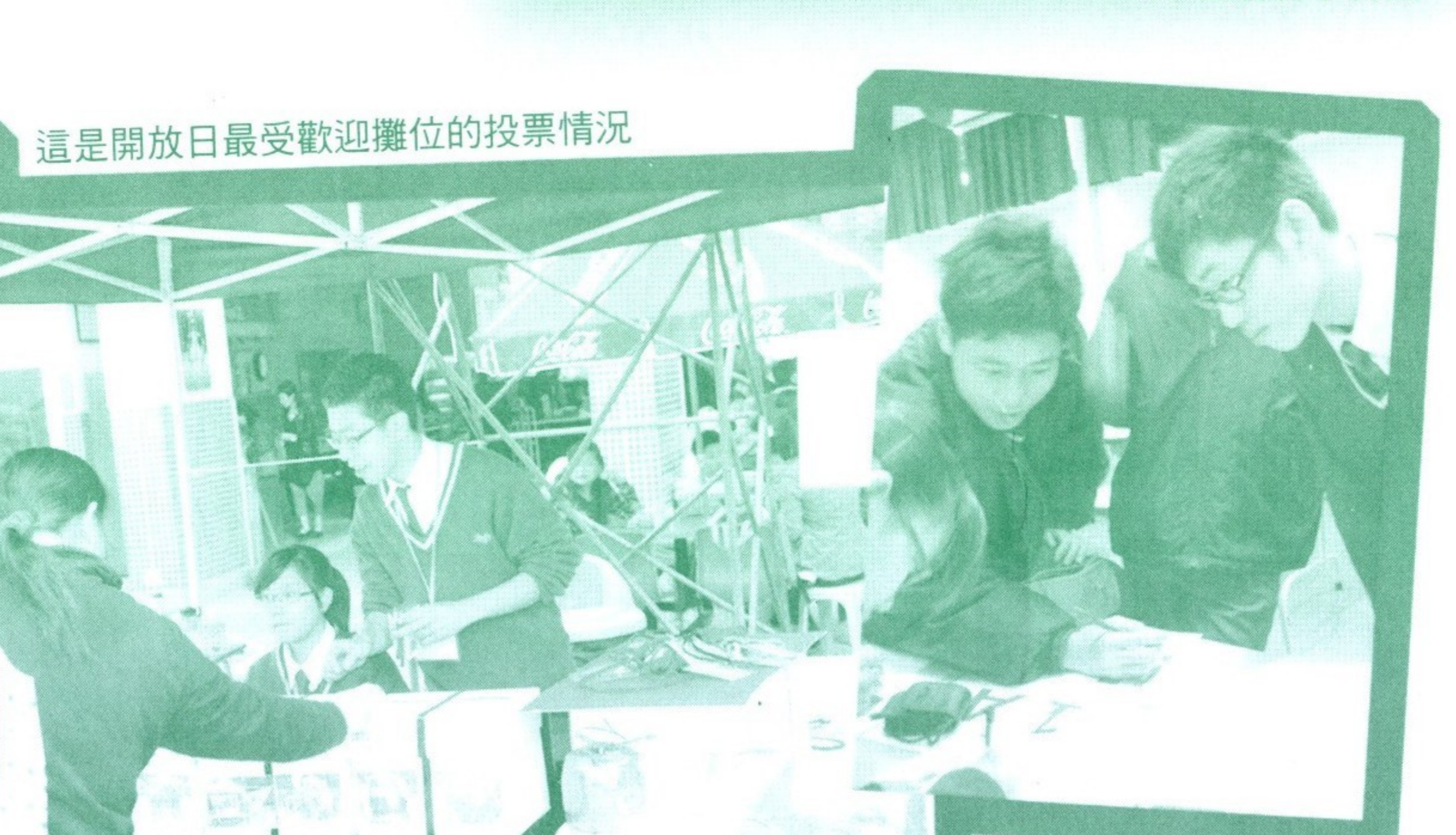
這是開放日最受歡迎攤位的投票情況