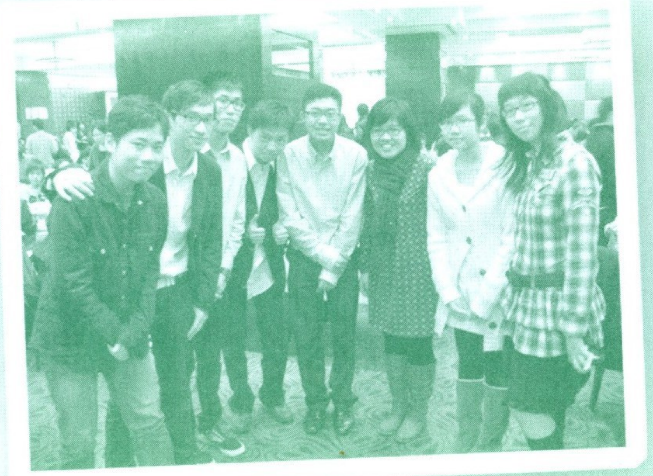
共和閣各幹事合照

學生會的職能在於成為師生之間的橋樑，透過師生了解及尊重，以了解彼此的意願，共同推動學校事務。本內閣同仁期望我校能繼續發展，作育英才。