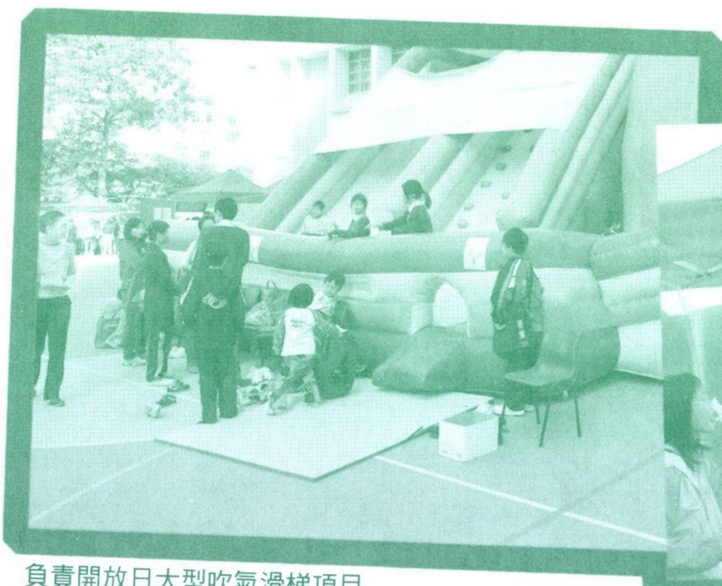
負責開放日大型吹氣滑梯項目