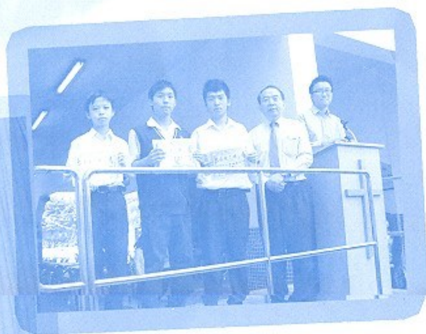
學生踴躍參與性教育週活動