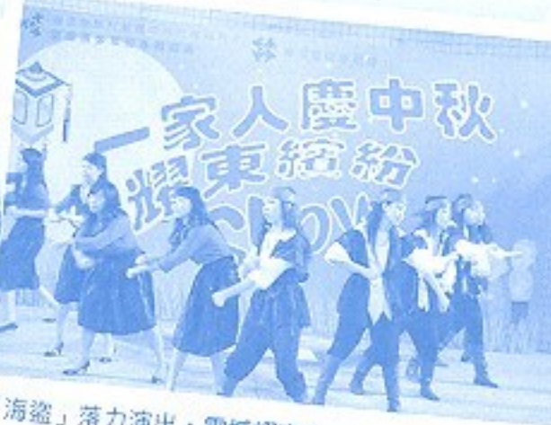
「海盜」落力演出，震撼耀東！