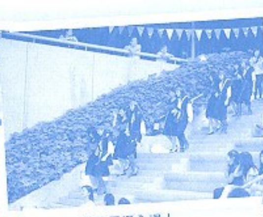
海盜進場，氣勢震攝全場！