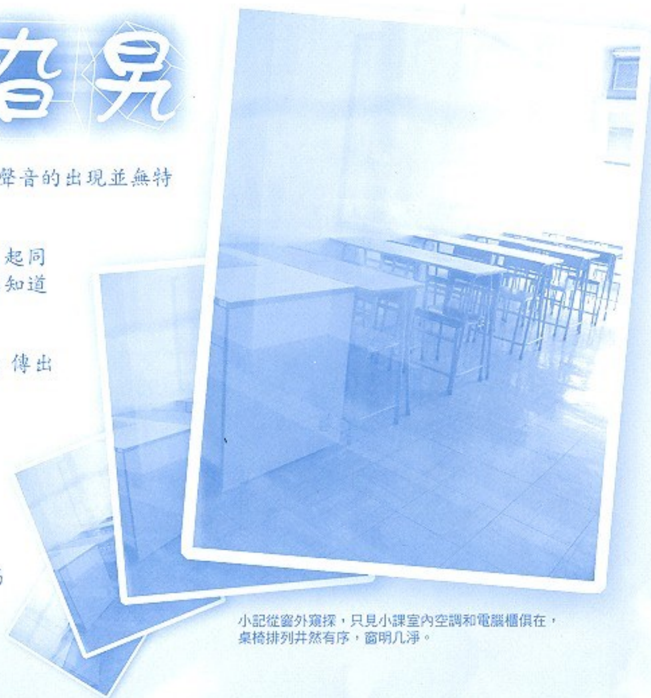
小記從窗外窺探，只見小課室內空調和電腦櫃俱在，桌椅排列井然有序，窗明几淨。