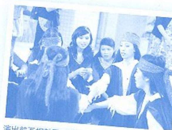
演出前互相鼓勵，祝演出成功。

表演當晚，會場座無虛席，擔任壓軸表演的Gypsy Girls不負眾望，使出渾身解數，以舞蹈表演，為耀東居民增添不少中秋佳節的歡樂氣氛。當日還有不少同學和師長到場為Gypsy Girls打氣呢！