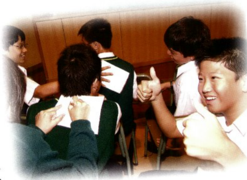
「閱讀閣壁報」的設立。