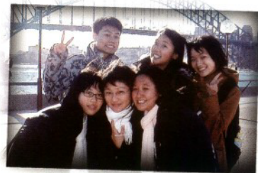
我們在悉尼大橋對面海拍照