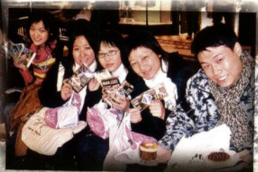
在購物廣場內品嚐最有特色的朱古力

這一份禮物讓我學懂何謂關懷、接納、勇氣，對我將來在面對社會人際關係時有很大的幫助。我能擁有這一份禮物真的要感謝神！