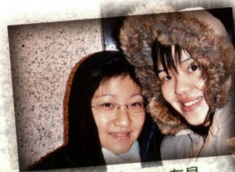
右是交流導師、左是劉永生中學學生