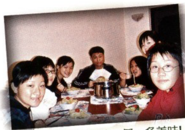
在宿舍內烹調的第一餐。多美味！