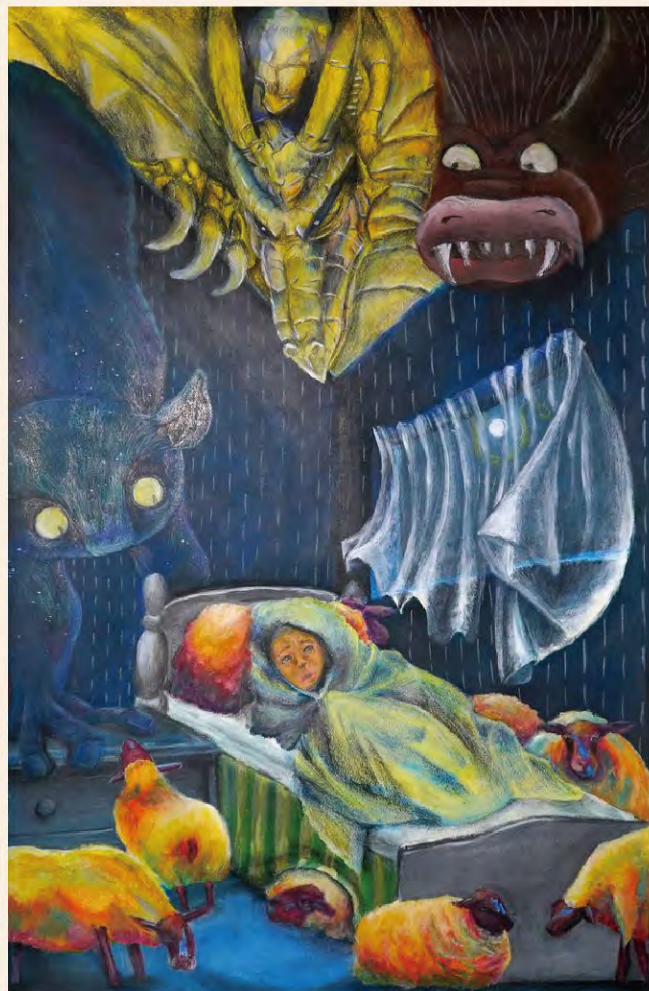
高中 冠軍 (20-21) 5D 蕭可婷

本校4位同學在暑假期間參與由馬鞍山青年協會所主辦的『青年藝術節2020』西畫比賽，並取得佳績。