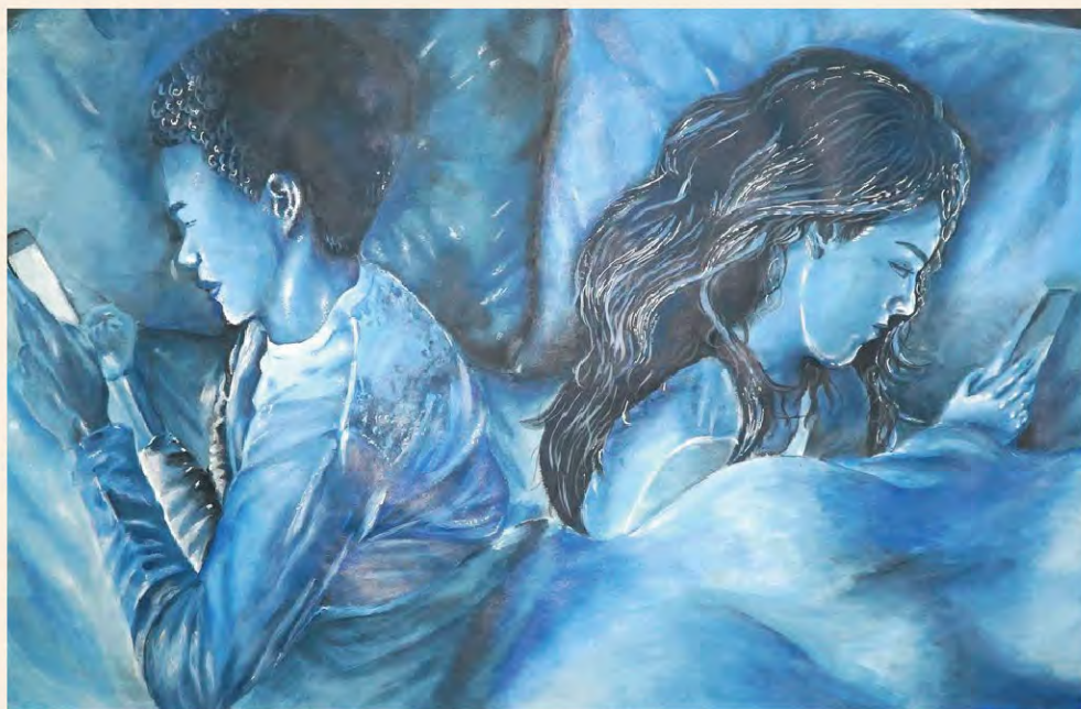
高中 亞軍 (19-20) 6C 蔡芷樺