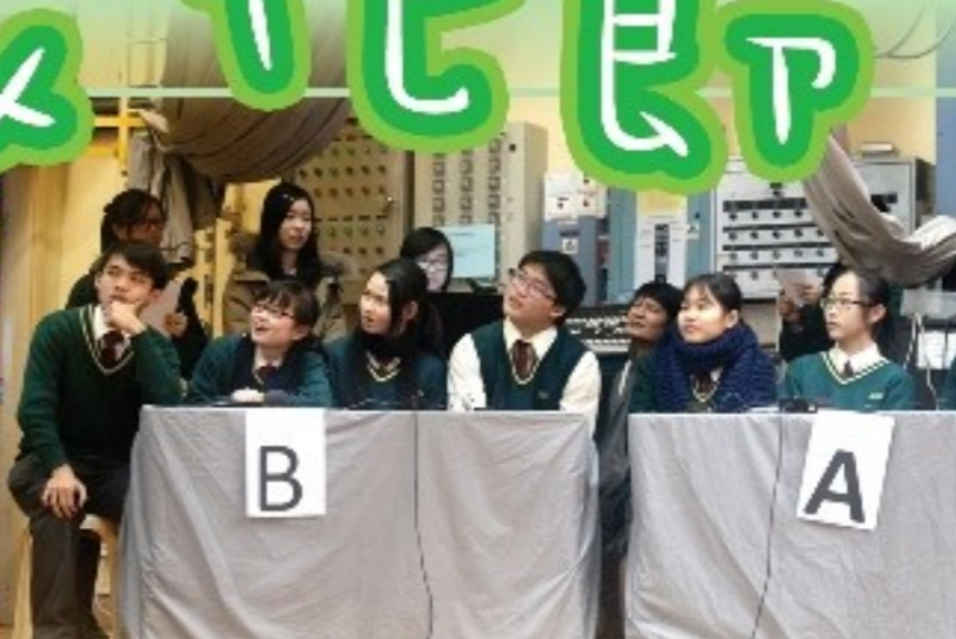
問答比賽：台上氣氛緊張