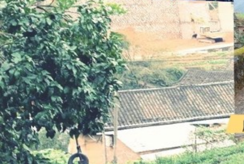
欣賞土樓外圍建築