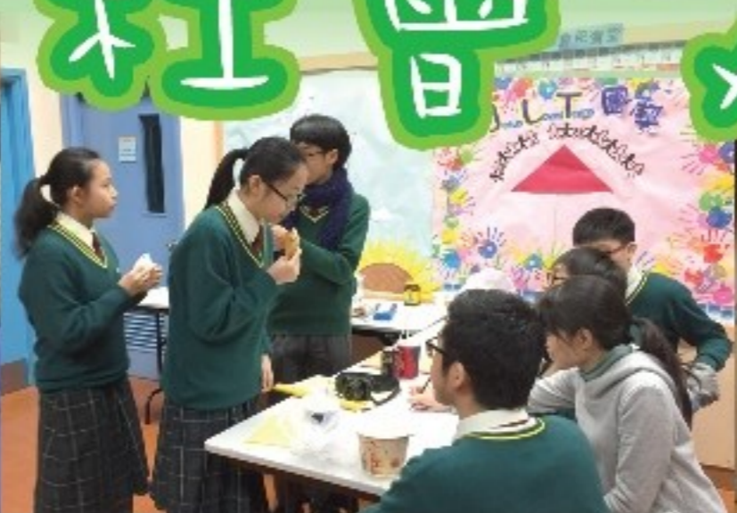
同學在欣賞電影之餘，也可淺嘗蜜糖水