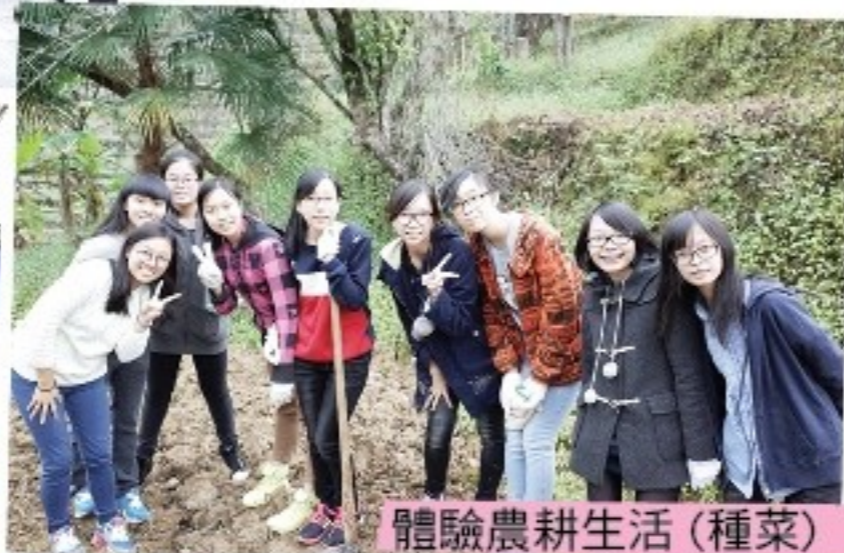
體驗農耕生活(種菜)