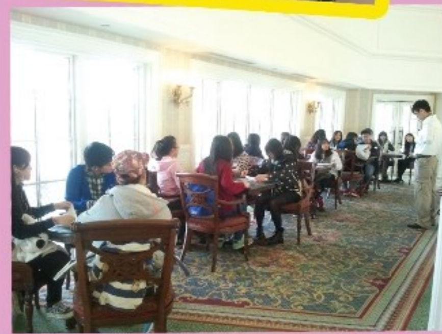
同學正學習製作迪士尼酒店送給兒童的動物形式餐巾。

我認識到酒店工作是需要很多方面的才能，例如懂多國語言、細心的態度、對待客人要有禮貌。「良好的態度能達致完美的演出」，最重要的還是待客之道。