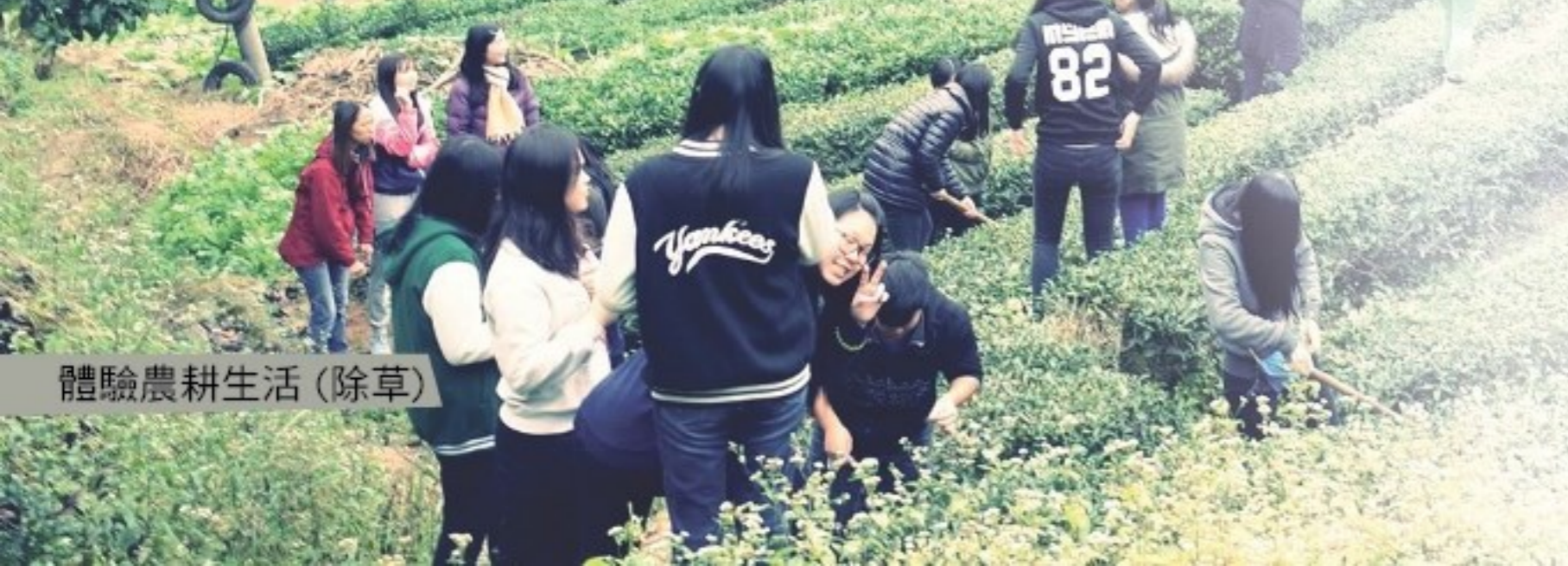
體驗農耕生活(除草)