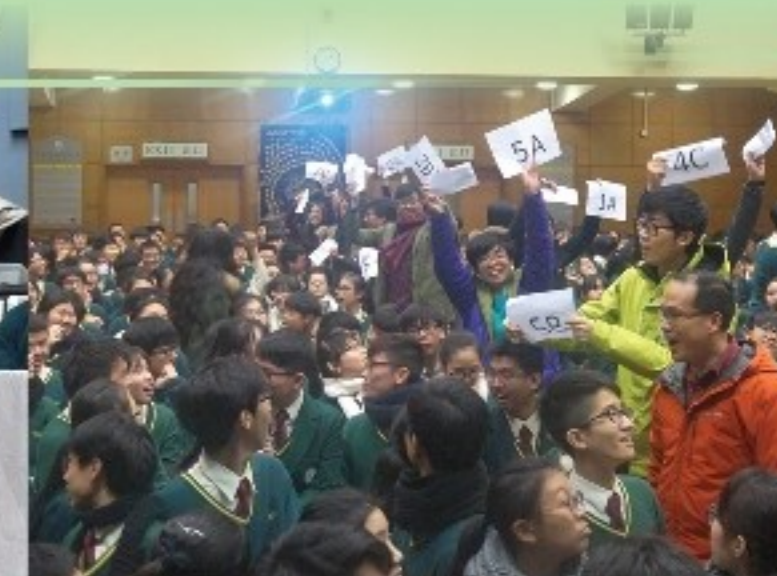
問答比賽：台下也為班際題盡力

社會文化節於2016年1月28至2月2日舉行，以「飲食：點止食飽咁簡單」為題，探究食物危機及飲食文化。除了早會短講外，我們還選取了一部德國電影 No More Honey (台灣譯作「蜜蜂工場」，香港僅在電影節放映)，供同學午膳時候欣賞。該片追蹤蜜蜂大量消失的原因，並提出蜜蜂的消失對人類影響極大。就了解世界飲食文化，我們又舉辦了以下三項活動：