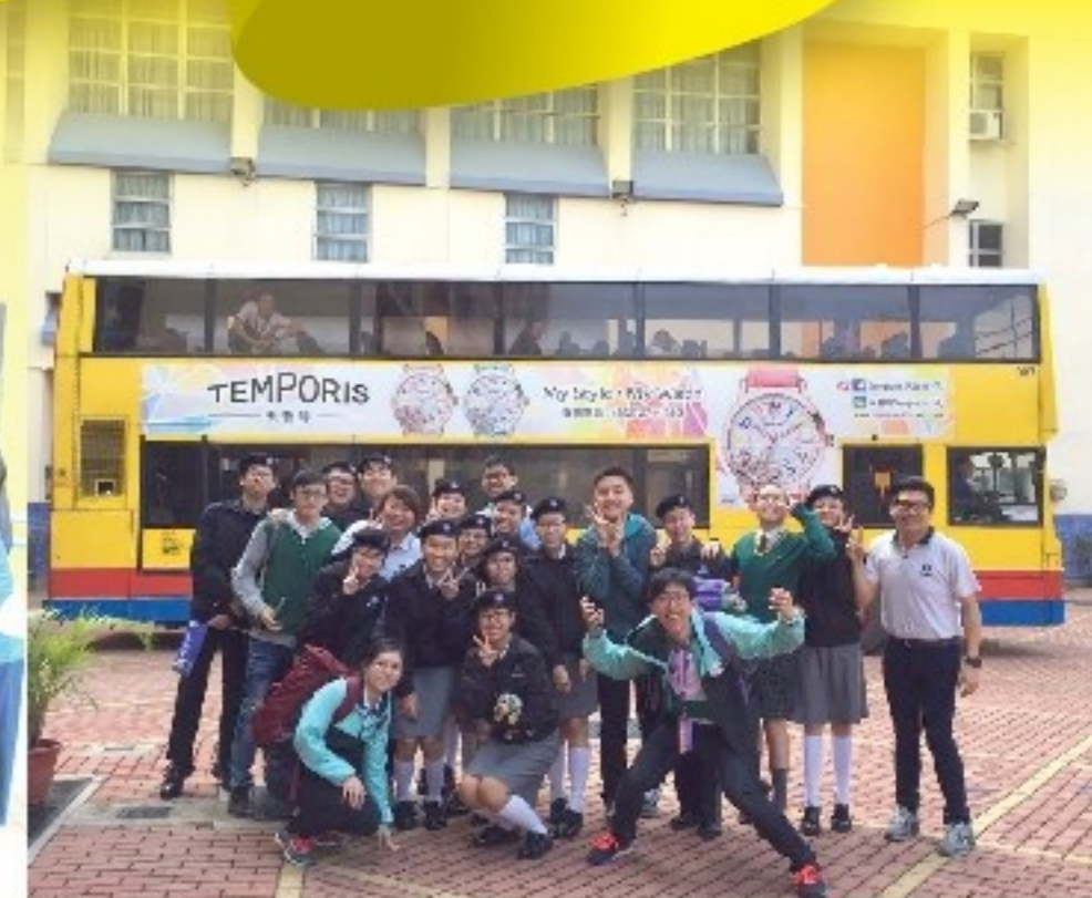
大巴駛入紅磚操場

今年1月2日至10日，香港聖約翰救傷隊總會舉行「百年周年國際青年交流營2016」，來自11個國家的隊員透過不同形式的活動交流，認識各國文化。交流團於1月8日來校參觀並探訪本校混合見習支隊，作國際文化交流。活動包括步操示範、集體遊戲、伸縮膠製作等交流。以下是同學感言：