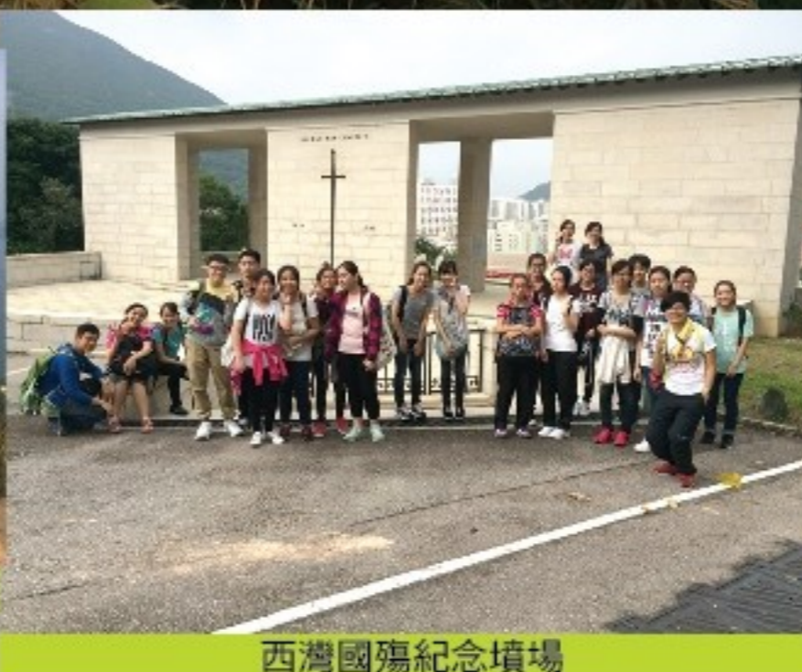
西灣國殤紀念墳場