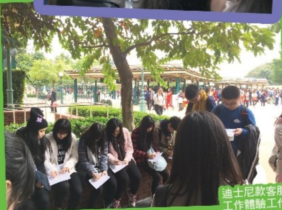
迪士尼款客服服務及 工作體驗工作坊