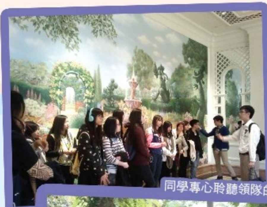
同學專心聆聽領隊的講解。