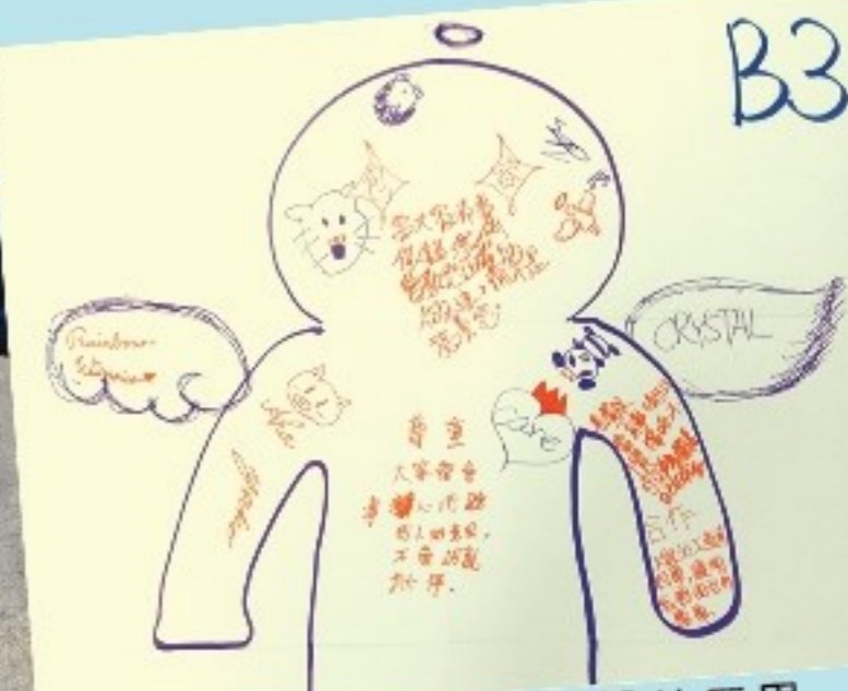
體驗日尾聲的反思