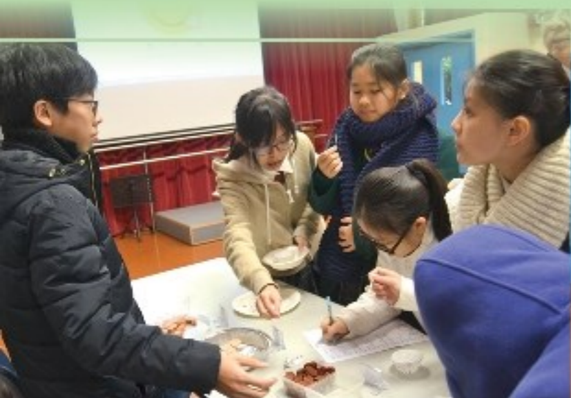
「聰明金舌頭」：同學一面試食，一面要回答問題