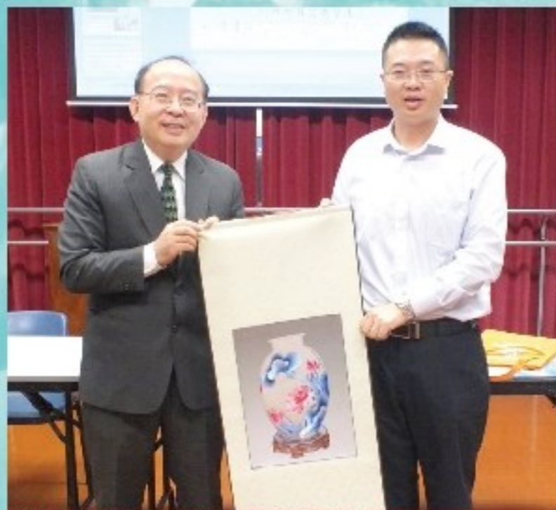
湖南及貴州教師代表送贈禮物