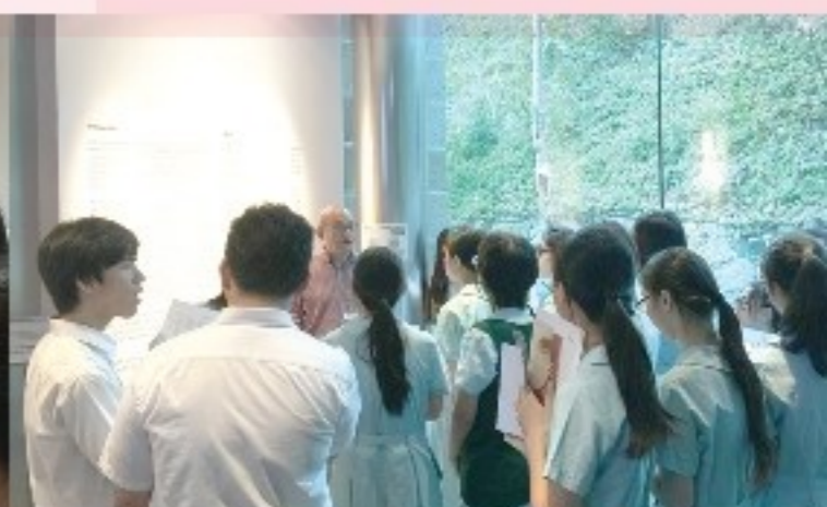
導賞義工講解奈良美智作品

18位中五視藝科同學於2015年5月29日，參觀由亞洲協會策劃及主辦的展覽及工作坊，藉欣賞奈良美智的作品，引發學生對生命的思考，激發創作思維。