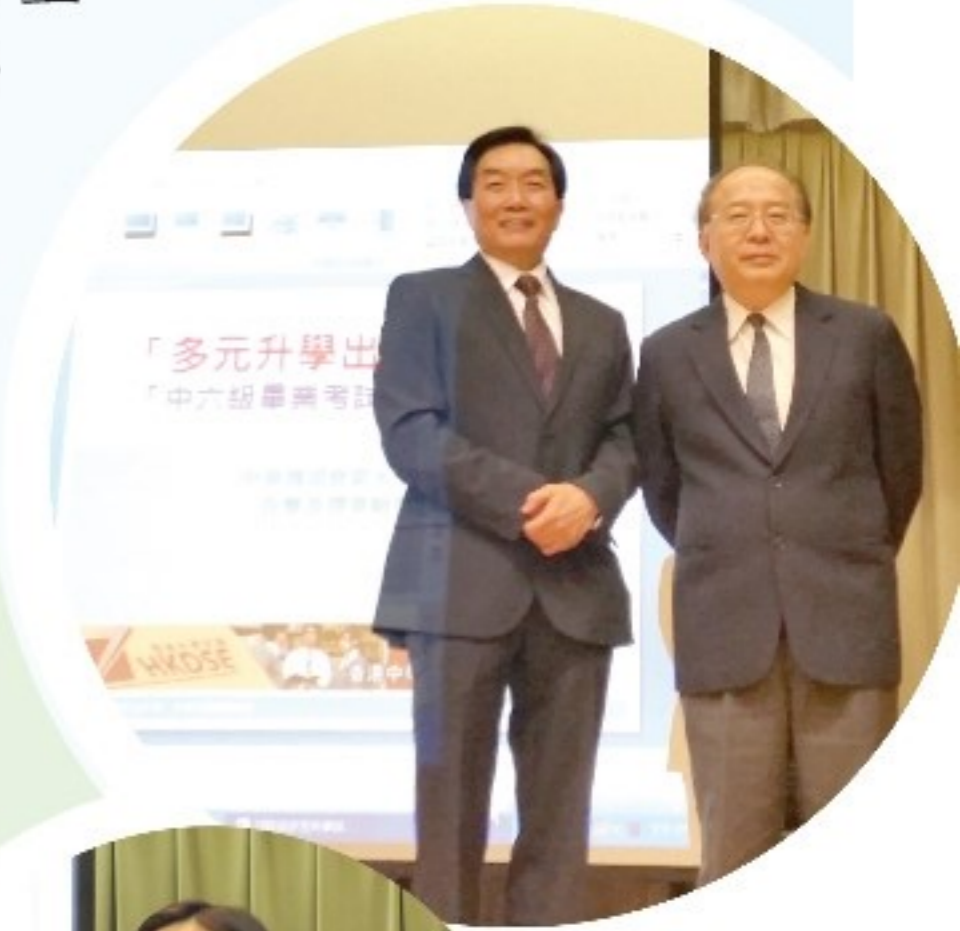
校長及崔博士合照

5月8日舉行放榜前升輔講座——多元升學出路介紹，包括「E-APP專上課程電子預先報名平台」的報名方法及注意事項、多元化出路介紹、面試技巧須知、內地高校免試申請詳情及解答升學及就業出路的疑問。7月7日再舉行升輔講座——中學文憑試放榜前準備講座，包括大學聯招注意事項及改選策略、香港中學文憑試放榜須知、中六重讀須知及解答升學及就業出路的疑問。以下是同學的分享：