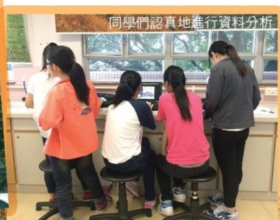
同學們認真地進行資料分析