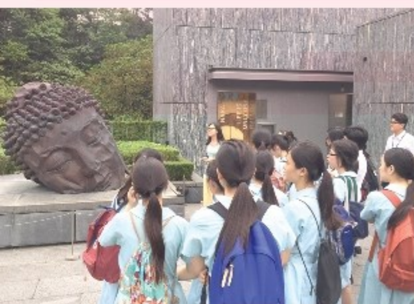
中心導賞員介紹亞洲協會