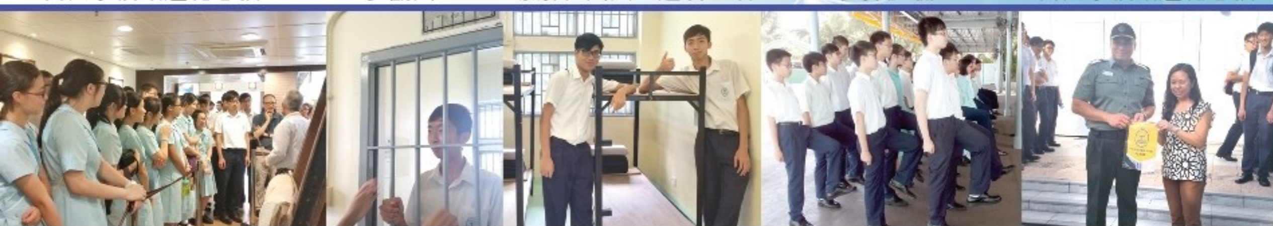
代表學校致送紀念旗