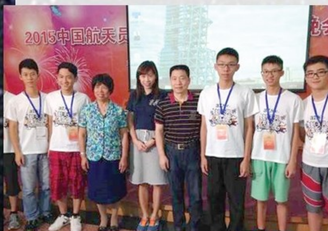
與神五楊利偉合影