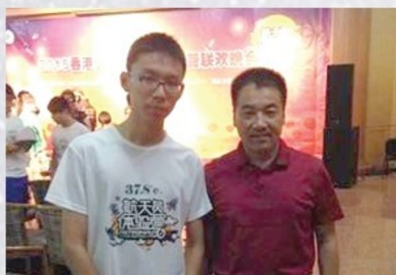
與神十劉曉光合影

令人意想不到的，在這車水馬龍，人來人往的熱鬧城市中，竟伫立著一片世外桃源般的地區。在慵懶的午後陽光照耀下，這裡的一切與外面的熱鬧不同，遠離了城市的嘈雜，顯得格外清幽寧靜。斜陽穿過葉隙，流淌在地上。漫步其中，微風流淌而過，樹枝輕輕晃動，發出輕柔的「沙沙」聲歡迎著客人的到來。這裡，就是北京航天城，世界三大航天員中心之一。