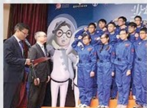
少年太空人體驗營 出發儀式