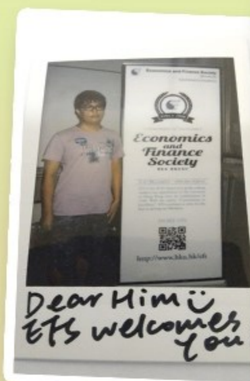
註冊日在加入Econ and Finance Society時拍照紀念

升上大學後，除了要修讀所選學系的科目外，還要修讀不同範疇的科目如科學、人文學科、有關全球和中國的議題等。由於我對選科的認識不多，所有參加了選科的講座加深對選科的認識。加上同學熱心的幫助，我才能夠在選科限期前選擇好心儀的科目，慢慢適應大學這個新的學習環境。