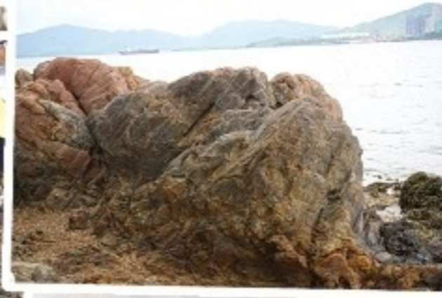
馬屎洲最古老沉積岩， 年齡達1億4000萬年