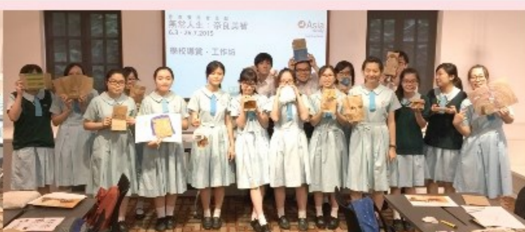
完成作品後大合照