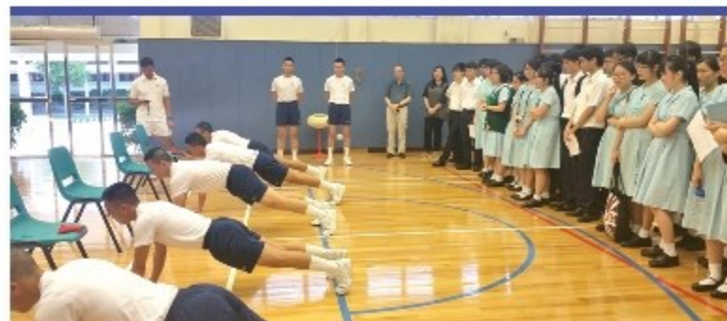
瞭解懲教入職要求

本校獲青年企業家發展局(YDC)甄選成為「生涯規劃先導計劃」六所中學之一，計劃大使到校擔任導師，透過一系列工作坊和活動，啟發同學建立正面思維，積極奮進，規劃個人的生涯和職涯藍圖。2月17日，青企局主席梁劉柔芬太平紳士蒞臨本校週會主持啟動禮，接著8位懲教署高級懲教主任於3月至5月期間蒞臨本校，為約60位中三至中五同學舉辦多次工作坊，及參觀赤柱懲教訓練學院及懲教博物館。以下是同學的分享：