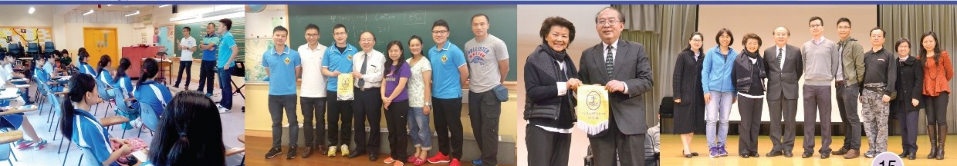
梁太、懲教主任、家教會成員、校長及老師大合照