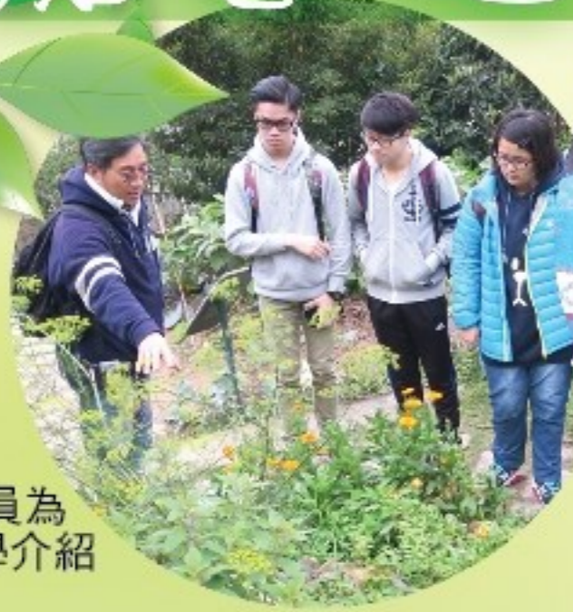
導賞人員為同學介紹