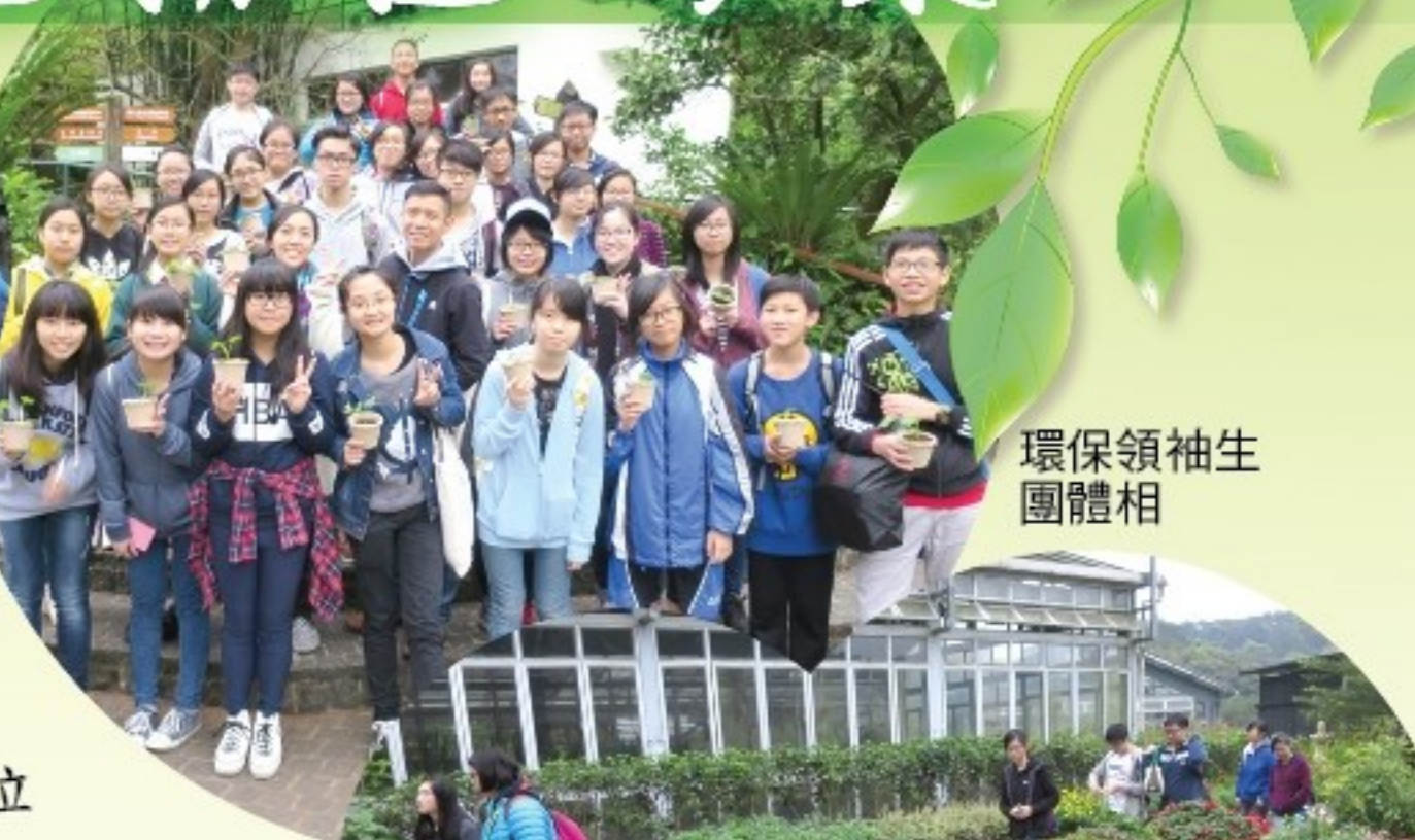
環保領袖生團體相