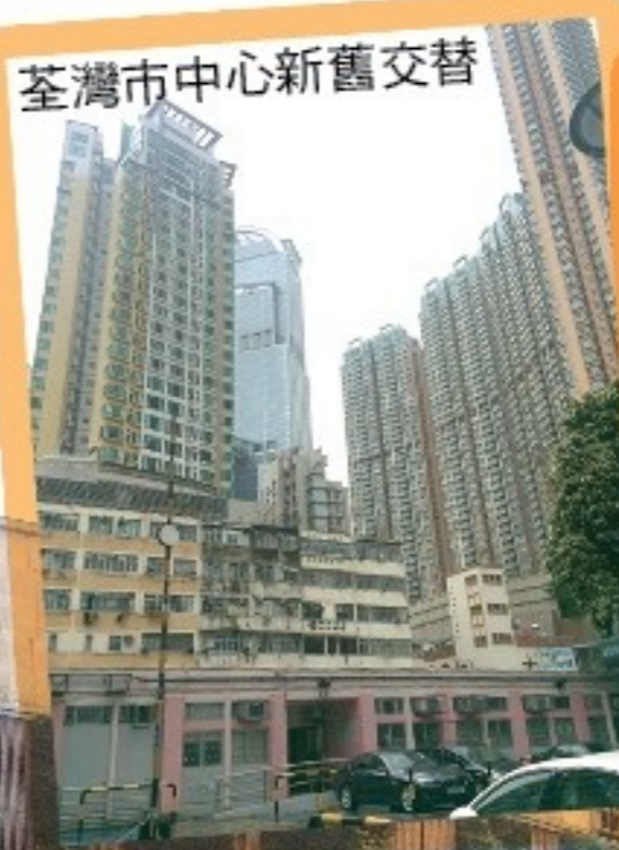
荃灣市中心新舊交替

在考察過程中，我們需要運用一些專業的儀器去測量荃灣市區的環境質素，例如噪音污染指數、空氣污染物數量等。雖然當日天氣變幻，但沒有阻礙我們享受考察的過程，反而讓我更深入了解該區的文化及城市發展情況，加深我對地理課題的認識。